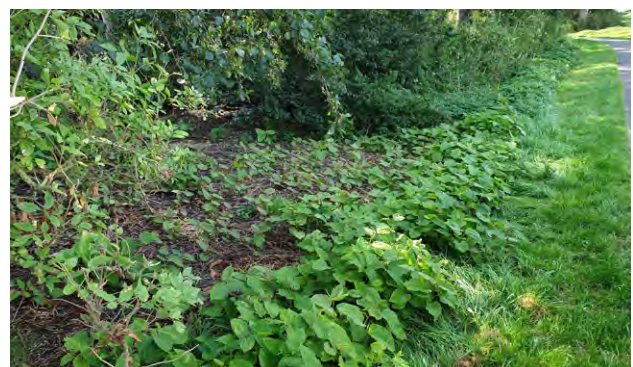
Japanse duizendknoop in het Egboetswater ten tijde van de tweede bestrijdingsronde. De plant wordt bestreden middels een elektrische lading waardoor de wortelstok beschadigd raakt. Heet water bleek niet afdoende

Het Recreatieschap heeft op een aantal plekken op de terreinen last van de Japanse duizendknoop. Hiertegen is nog geen afdoende bestrijdingsmethode gevonden. We proberen met de beschikbare methoden de besmette plaatsen in toom te houden. Tot op heden lukt dit vrij aardig.