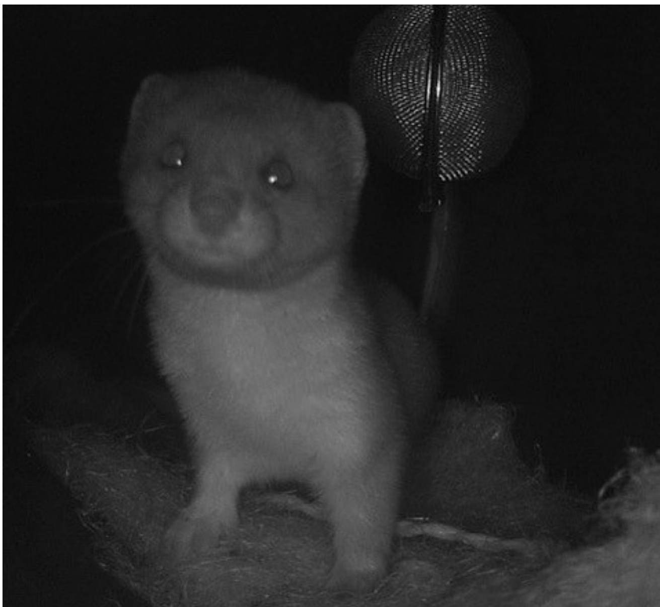
De meest fotogenieke wezel (Mustela nivalis) van het Egboetswater in de WMS Beeldbuis

De wezel is het kleinste roofdier van Europa en is overdag actief. Een bunzing behoort ook tot de marterachtigen en is net als de wezel overdag te zien. U zou ze beide in het Egboetswater tegen kunnen komen.