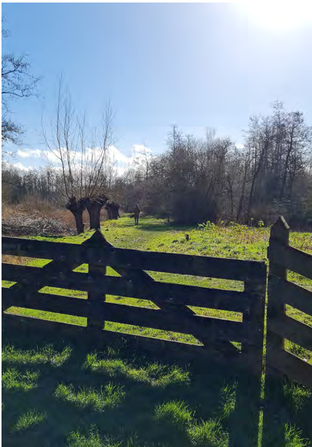
In het Ecoproject in het Streekbos dat door IVN West-Friesland wordt beheerd mag de natuur haar gang gaan

De voorbereidingen voor RecreActief Westfriesland in 2022 zijn inmiddels al begonnen. We kijken ernaar uit om tijdens deze bijeenkomst kennis te maken met (oude en) nieuwe raadsleden die zijn gestart na de gemeenteraadsverkiezingen van 16 maart 2022.