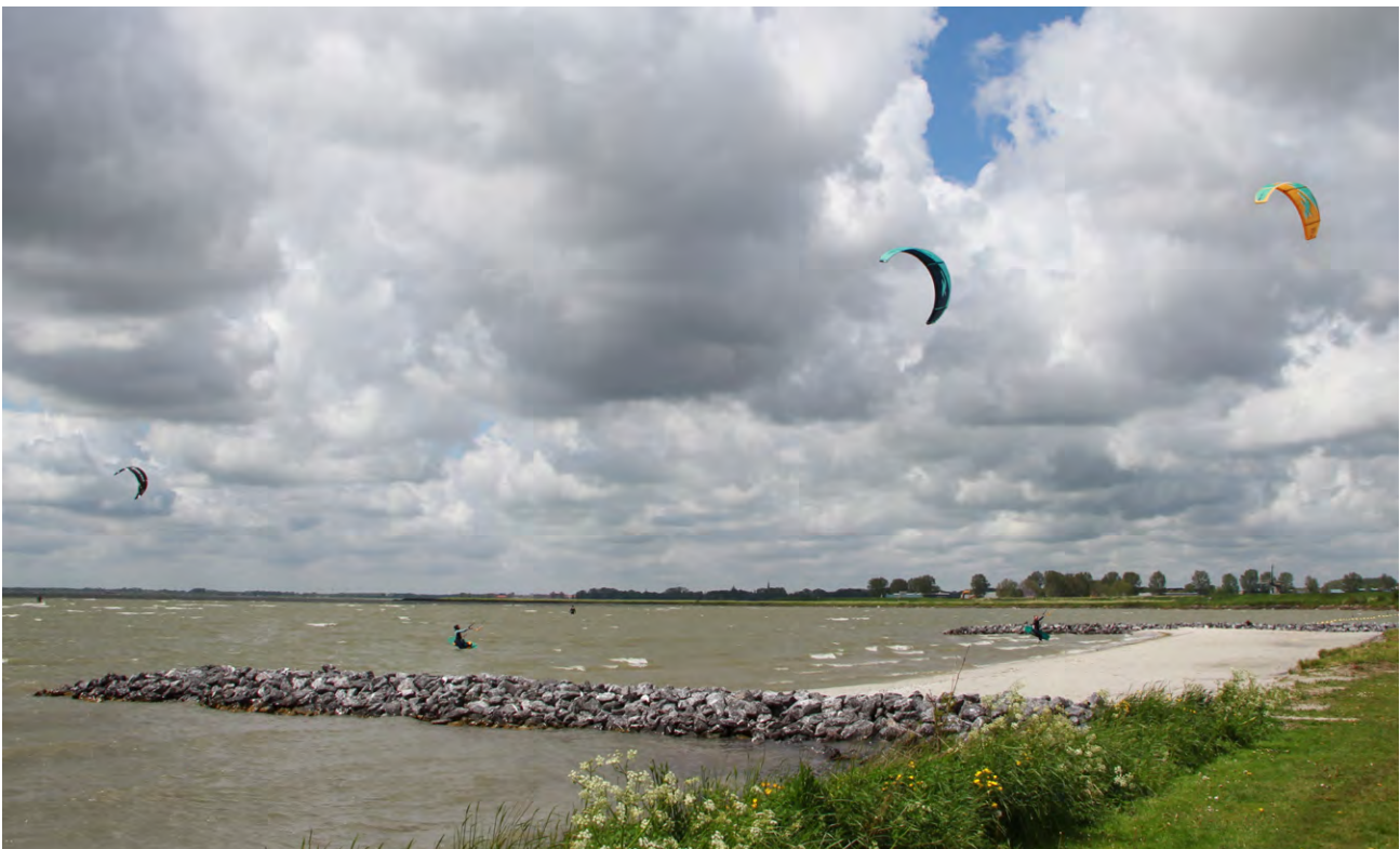
Ook internationaal is het (kite)surfstrand bij Schellinkhout goed bekend