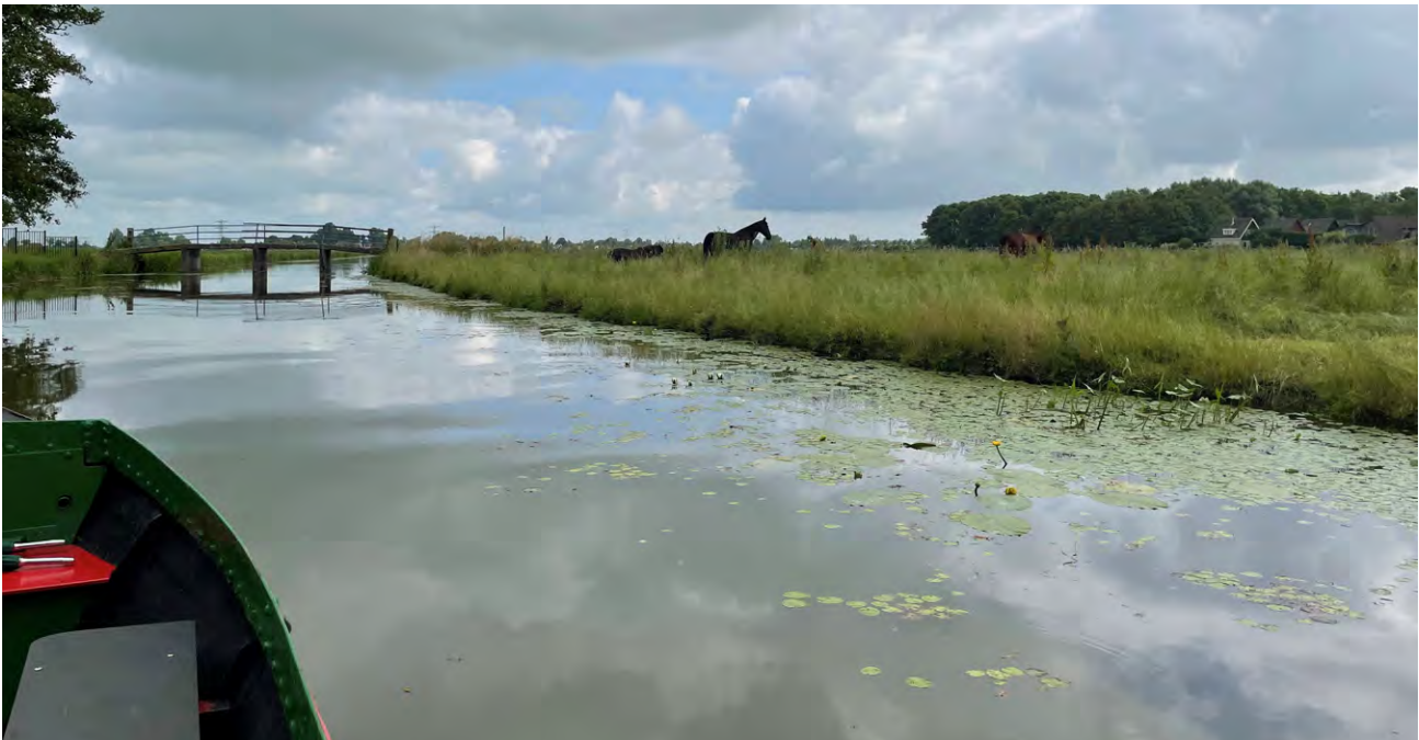
Het vaarrouten netwerk in de regio is prachtig maar nog niet op alle plekken zo mooi bevaarbaar als hier

In 2022 wordt gestart aan het oplossen van een aantal knelpunten in het netwerk in het oostelijk deel van onze regio, in de gemeente Koggenland. De gemeente voert dit project uit. Het Recreatieschap heeft een adviesrol gespeeld en ondersteunt in de afhandeling van de subsidieaanvraag.