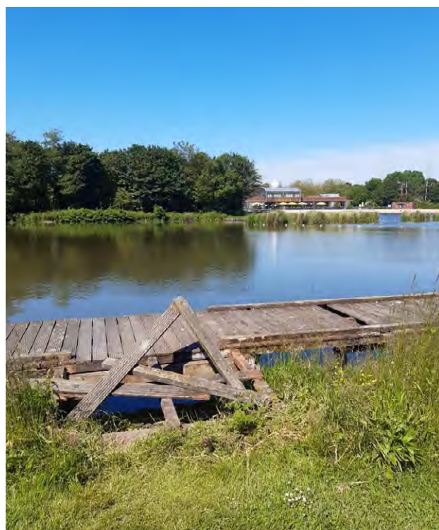
Een steiger moest het ontgelden in het Streekbos