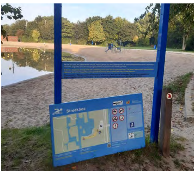
Een zwempaneel van de provincie. Losgemaakt maar 'netjes' laten staan