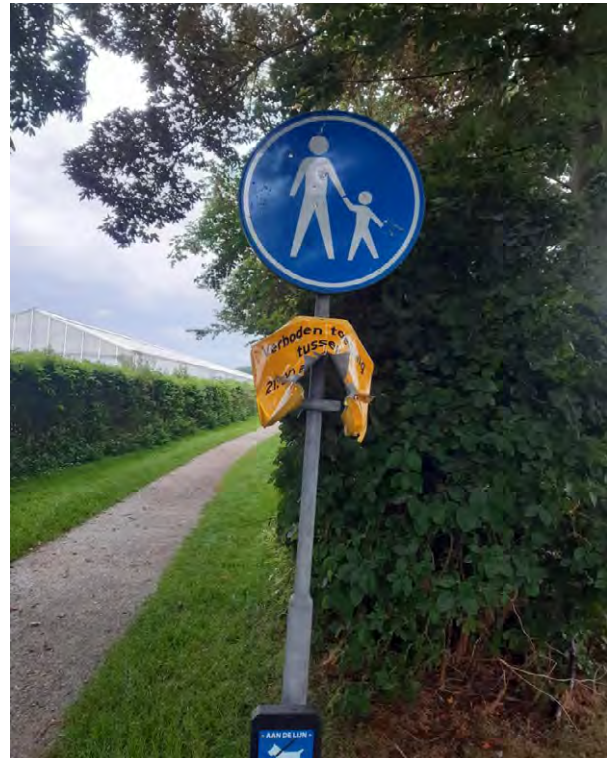
Het bordje met sluitingstijden is zo niet meer leesbaar

In overleg met de politie, de BOA's en het Recreatieschap besluit de gemeente om het terrein 's nachts af te sluiten. De samenwerking is belangrijk omdat de gemeenten verantwoordelijk zijn voor de handhaving op onze terreinen. De afspraak is dat het Recreatieschap de voorzieningen als borden en slagbomen plaatst.