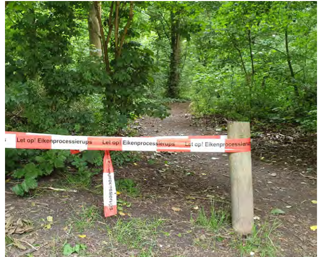
Waarschuwinglinten wegens de eikenprocessierups

Mogelijk is het koele voorjaar er de oorzaak van dat de rups later uit de eitjes kruipt. Een feit is dat de eikenprocessierups jaarlijks zal terugkeren. Het Recreatieschap zal zoveel mogelijk proberen de overlast te beperken.