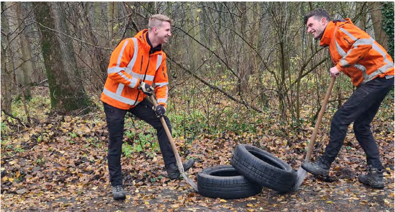
Het Recreatieschap scheidt een band (helaas wel illegaal gedumpt...)

Gelukkig is er naast het harde werken ook tijd voor een lolletje.