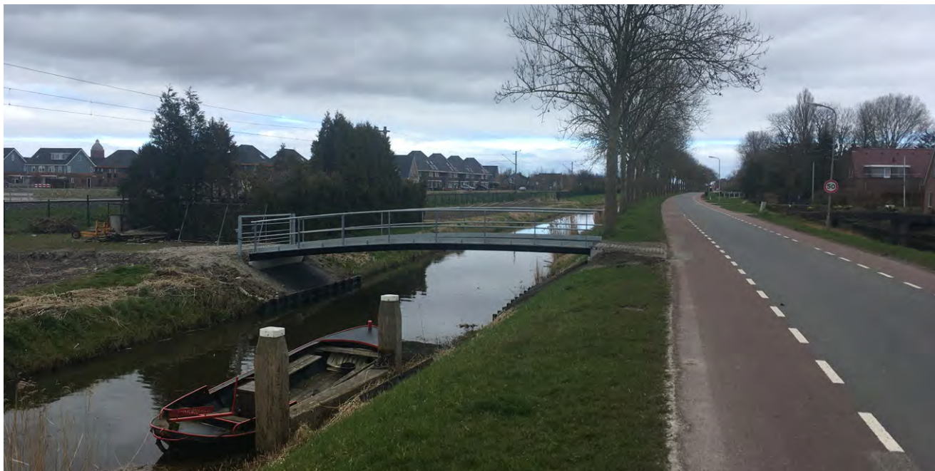
Vaarroute Enkhuizen - Hoorn beter bevaarbaar door nieuwe bruggen in Hoogkarspel (Drechterland)

In de gemeenten Drechterland en Medemblik is een aantal knelpunten in het vaarrouthenetwerk aangepakt. Hoogkarspel kreeg in 2021 drie nieuwe bruggen waardoor de vaarroute Enkhuizen-Hoorn ook voor grotere bootjes bevaarbaar werd. In Zwaagdijk is in 2020 al een oude brug vervangen en is in Twisk de beschoeiing vernieuwd en doorvaarbaarheid verbeterd.