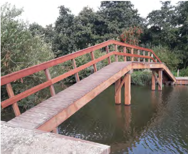
Een nieuwe brug in het Egboetswater