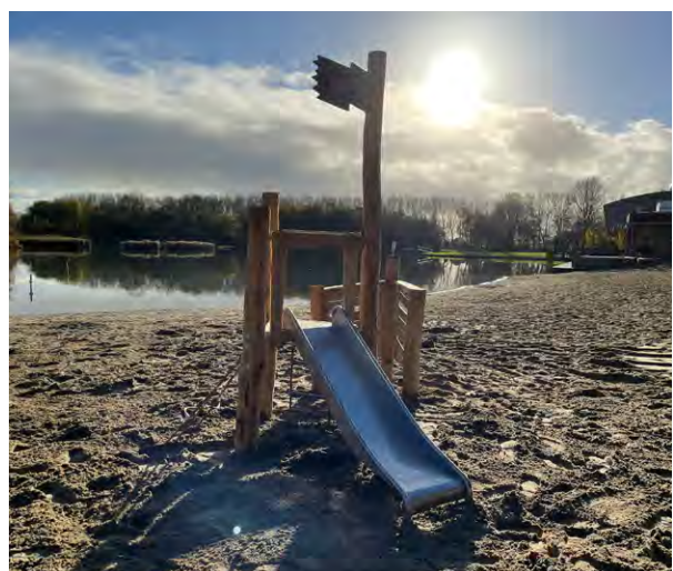
En een glijbaan voor de kleintjes in het Streekbos

Bij het strand aan de zwemplas wordt voor de allerkleinsten een nieuw glijbaantje geplaatst.