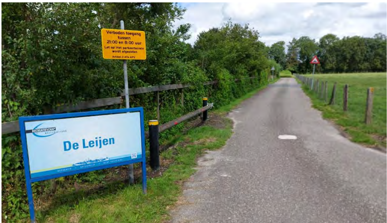
Een afsluitboom tegen ongewenste gasten