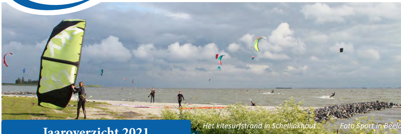
Het kitesurfstrand in Schellinkhout