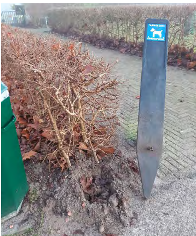
Een verwijderde 'honden aangelijnd'-paal in het Streekbos.

Het bedrag dat nodig is voor herstel en schoonmaak bedraagt dit jaar minimaal € 15.000,-. Dit gemeenschapsgeld had het Recreatieschap graag besteed aan de voorzieningen op de terreinen en de netwerken.