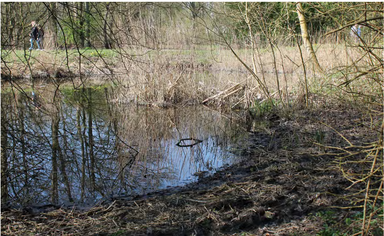
In het Ecoproject zijn veel oevers natuurvriendelijk aangelegd