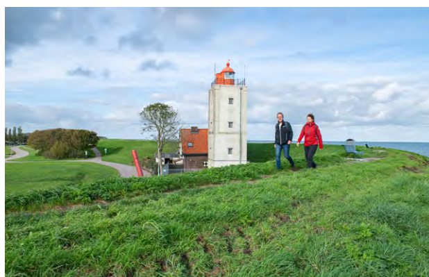
Wandelaars van het Streekpad Westfriese Omringdijk passeren vuurtoren De Ven bij Enkhuizen.

Het is de bedoeling dat de filmpjes in het voorjaar van 2022 online komen op de website van Wandelnet en in de app van Wandelnetwerk Noord-Holland.