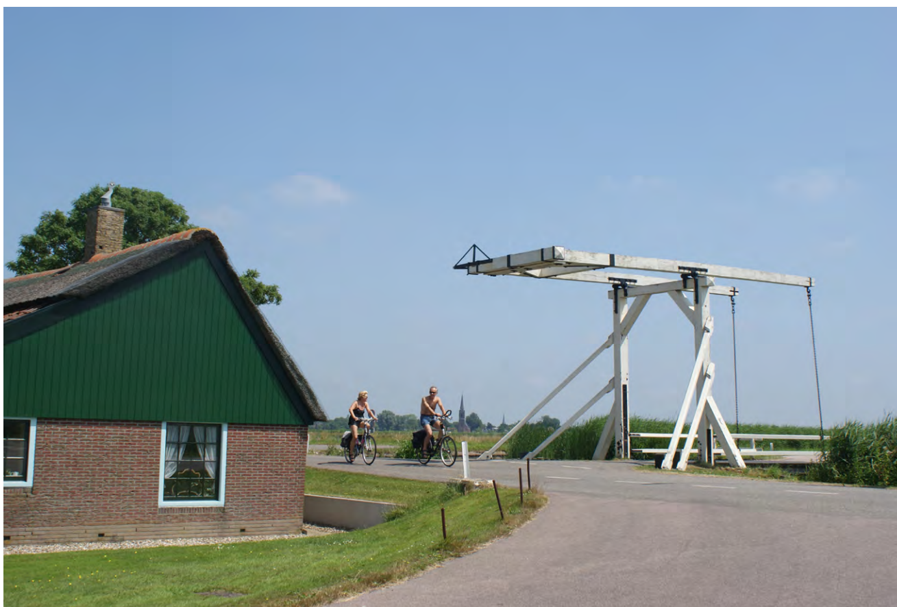
Fietsers bij de iconische wipbrug in Opmeer

De resultaten zullen te zijner tijd in de Nieuwsbrief worden gedeeld.