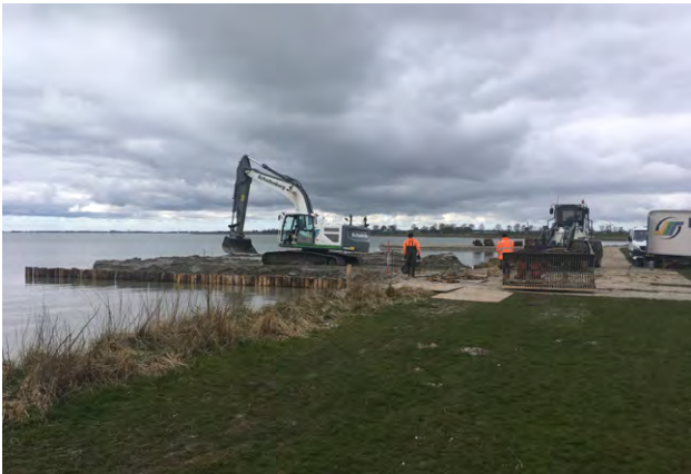
De werkzaamheden starten in maart

In samenwerking met diverse partijen legt het Recreatieschap begin 2021 ten oosten van het zwemstrand aan de Uiterdijk in Schellinkhout een (kite)surfstrand aan. Op deze manier kunnen zwemmen en (kite)surfen op een veilige manier gescheiden plaatsvinden. De scheiding in het terrein wordt duidelijk aangegeven. Daarnaast staan er informatieborden zodat duidelijk is waar (kite)surfers hun spullen kunnen neerleggen en de vliegers kunnen oplaten en welk deel als ligweide is bestemd. Op dat deel is (kite)surfen niet toegestaan.