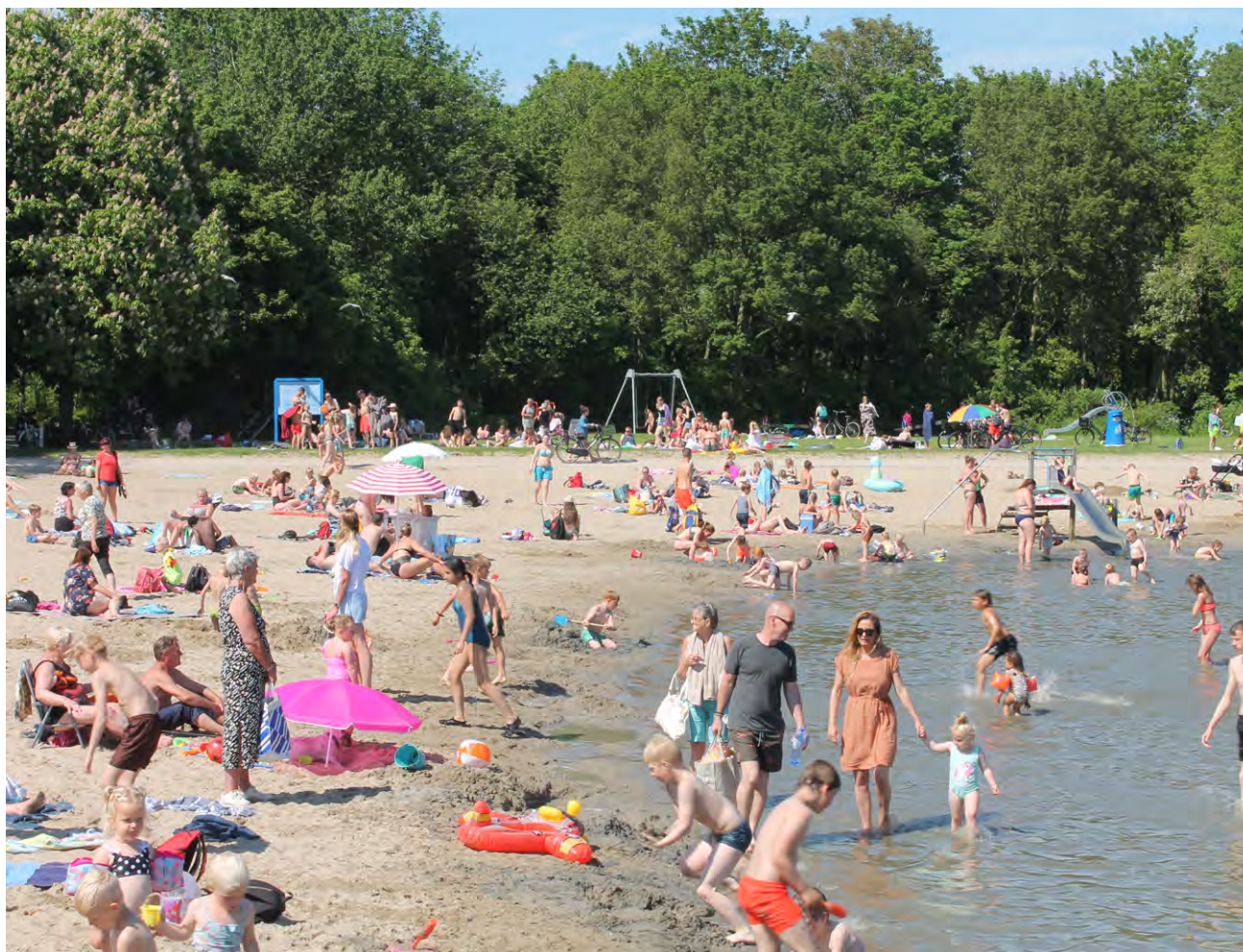
Het Streekbos, altijd al een trekpleister, bewijst eens te meer zijn waarde tijdens de coronapandemie

De horecapachters in het Streekbos en op de Vooroever bij Medemblik draaien zo goed als met de coronamaatregelen mogelijk is. Het algemeen bestuur besluit net als het voorgaande jaar om de horecapachters financieel tegemoet te komen.