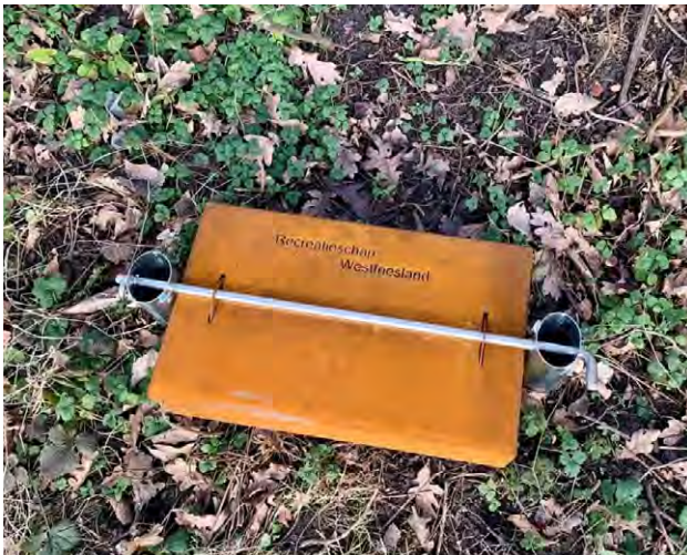
Een vangbox voor ratten