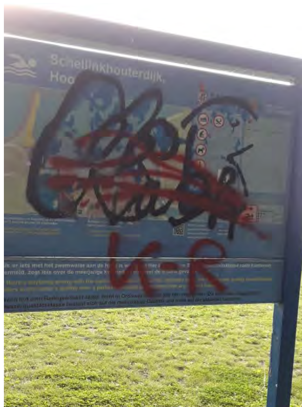
Graffiti op een zwempaneel. Het Recreatieschap probeert met andere partijen de schade op de daders te verhalen