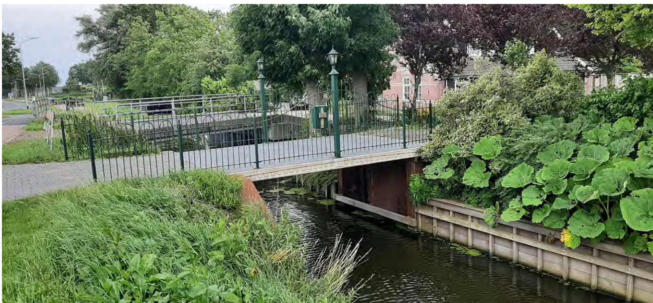
Nieuwe brug in Zwaagdijk (Medemblik)