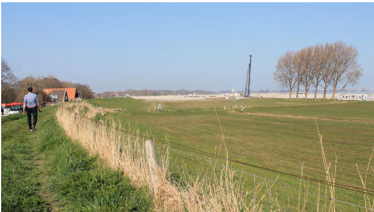
Wandelaar op de dijk bij Scharwoude. Hier, bij het buitendijkse deel van recreatiegebied De Hulk, wordt hard gewerkt aan de dijkverzwaring en de aanleg van een fiets-/wandelpad tussen Hoorn en Amsterdam

De uitvoering van de dijkverzwaring langs het Markermeer biedt een mooie gelegenheid om een aantal wandel- (en fiets)routes te verbeteren dan wel om te leggen. In de loop van 2022 worden dan ook de informatiepanelen in de omgeving aangepast.