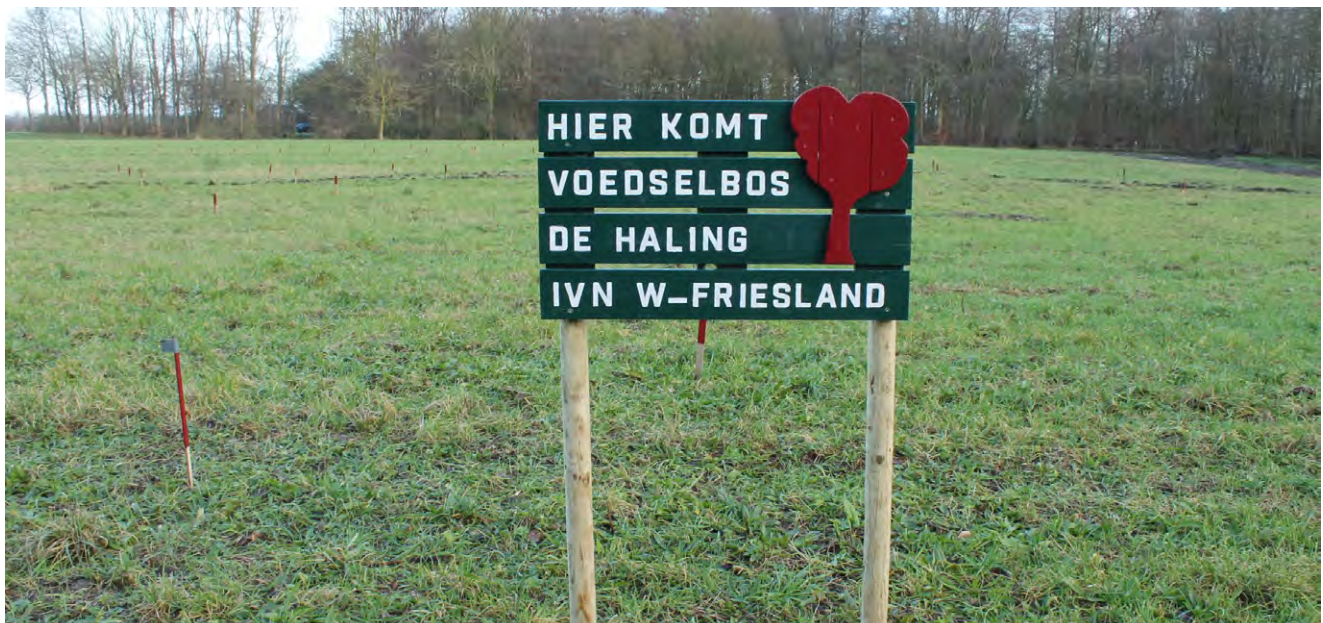
Nu nog niets te zien, maar het Voedselbos zal in 2022 officieel worden geopend bij het vijftigjarig bestaan van IVN West-Friesland