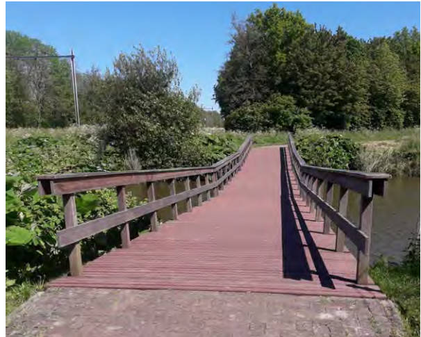
Een van de twee gerenoveerde bruggen in De Hulk

In De Hulk worden twee bruggen vernieuwd met gebruik van duurzame materialen; hergebruikt kunststof voor het brugdek en de leuningen zijn van bamboe. De vernieuwing van de bruggen gebeurt gefaseerd.