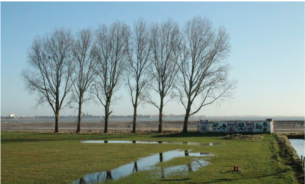
Het badhuis bij Scharwoude is in de plannen voor de opwaardering van recreatiegebied De Hulk meegenomen

Het project lift mee in het Ambitieprogramma Ruimtelijke Kwaliteit Kustzone Hoorn-Amsterdam, zoals ook gebeurt met de doorlopende fiets- en wandelverbinding tussen Hoorn en Amsterdam.